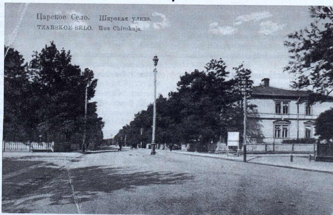
Рис. 3. Фотосалон К.Е. фон Гана – Царское село, ул. Широкая