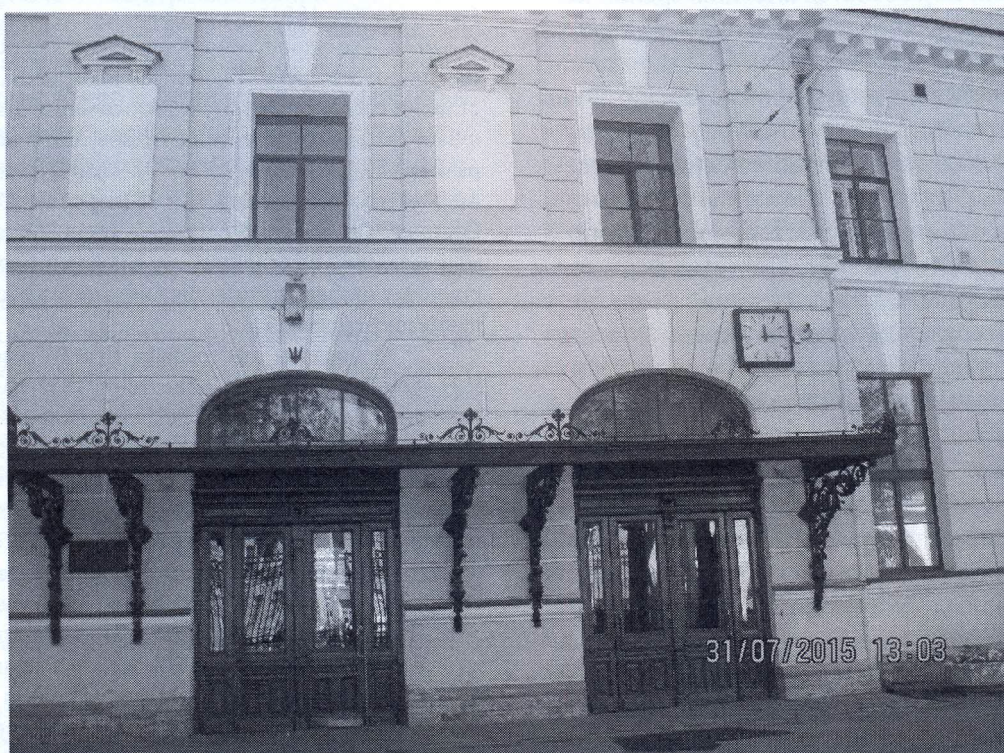
Рис. 2. Здание Учетно-судного банка – Санкт-Петербург, Екатерининский канал (канал Грибоедова), 30/32