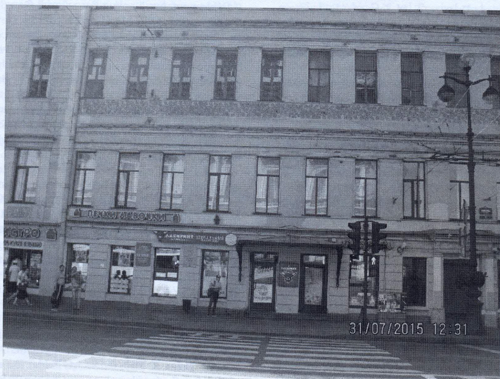
Рис. 4. Фотомагазин Ф. Иоахима – Санкт-Петербург, Невский проспект, 3